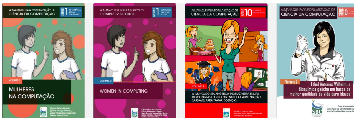
Figura 3 - Gibis do Almanaque para Popularização de Ciência da Computação envolvendo a Temática Feminina